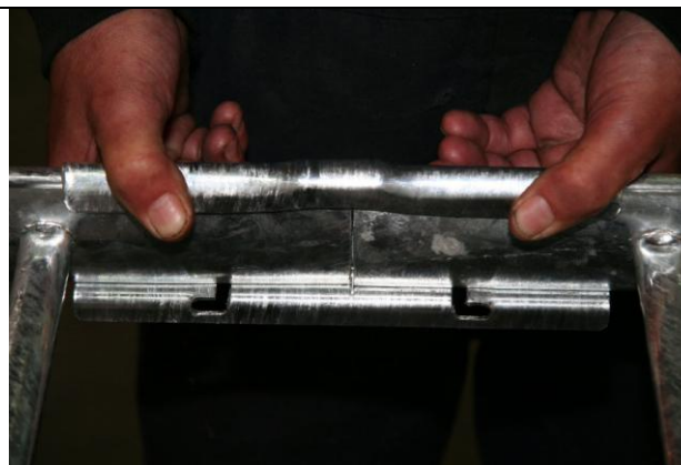
Fig. 2.: Kabelstigerne lægges i forlængelse af hinanden (med vulsten opdad). Lasken placeres og underkanten presses ind på vangen, evt. med et dask af en gummihammer. Bemærk at lasken også kan sættes på indersiden af stigen