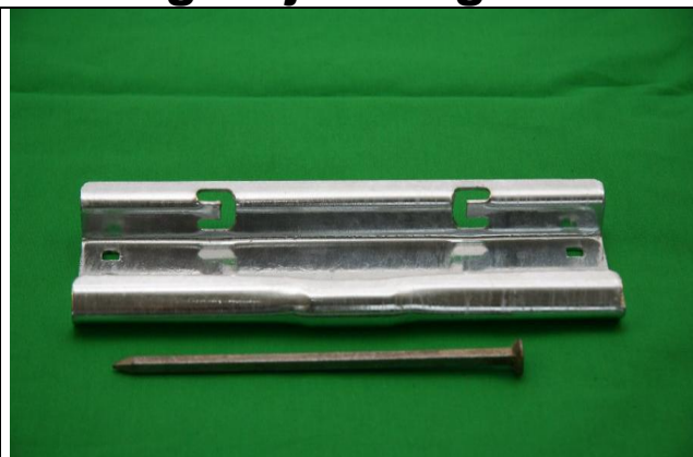
Fig. 1.: Lasken består af en komponent, hvori der er udformet 2 låseflige. Sømmet ved siden af (55/160), kan anvendes til at sætte lasken på plads på stigen, og til at vejne låsefligene. En skruetrækker kan også bruges.