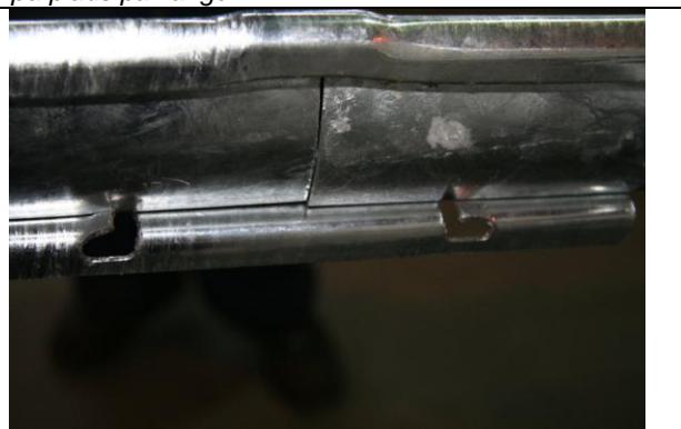
Fig. 6.: Lasken er nu låst. Låsefligene kan løsnes igen ved at vejne modsat med sømmet, eller ved at slå låsefligen nedad.