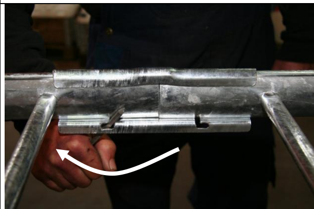
Fig. 5: Låsefligene vejnes ved at sømmet skubbes mod låsefligen parallelt med stigen vange.