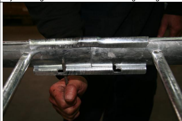
Fig. 3.: Sømmet placeres i lasken ved låsefligen.