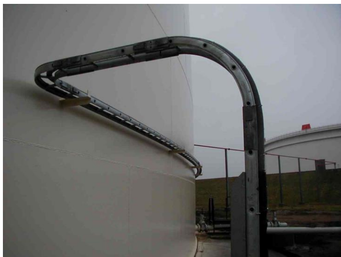
Fig.1: Horizontal montage af KS 150 mm kabelstige på olietank

Bygningers geometri kan give udfordringer, når kabelstiger skal monteres. Især når der er tale om bygninger med krumme flader. Ofte er det tankanlæg eller siloer, som er bygget op af runde (krumme) flader.