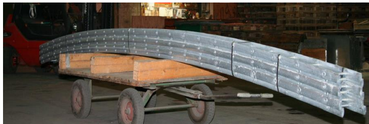
Fig.3.: KS 200 mm kabelstige fremstillet til vertikal montage på tankanlægs gelænder med radius på 37,7 m.

Du skal blot oplyse ønsket radius, samt om stigerne skal have horisontal- eller vertikal krumning, Så leverer vi stiger, der passer til dit projekt.